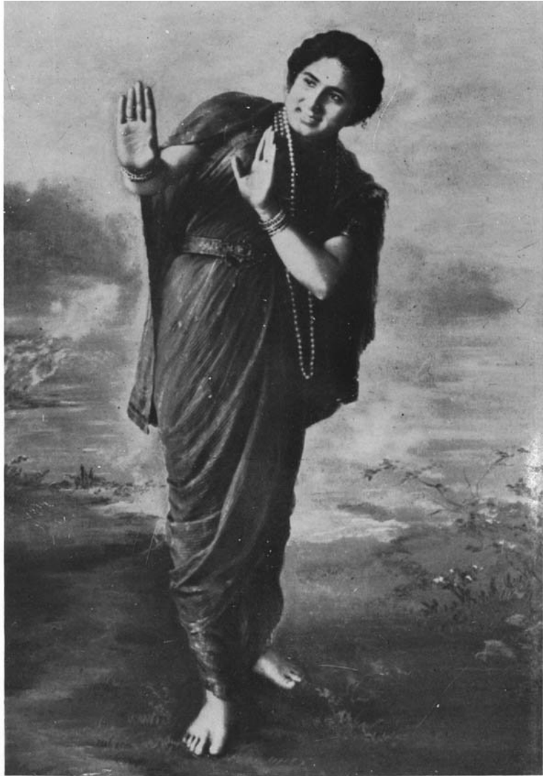
Bal Gandharva as Rukmini in the play Swayamwar written by K.P. Khadilkar